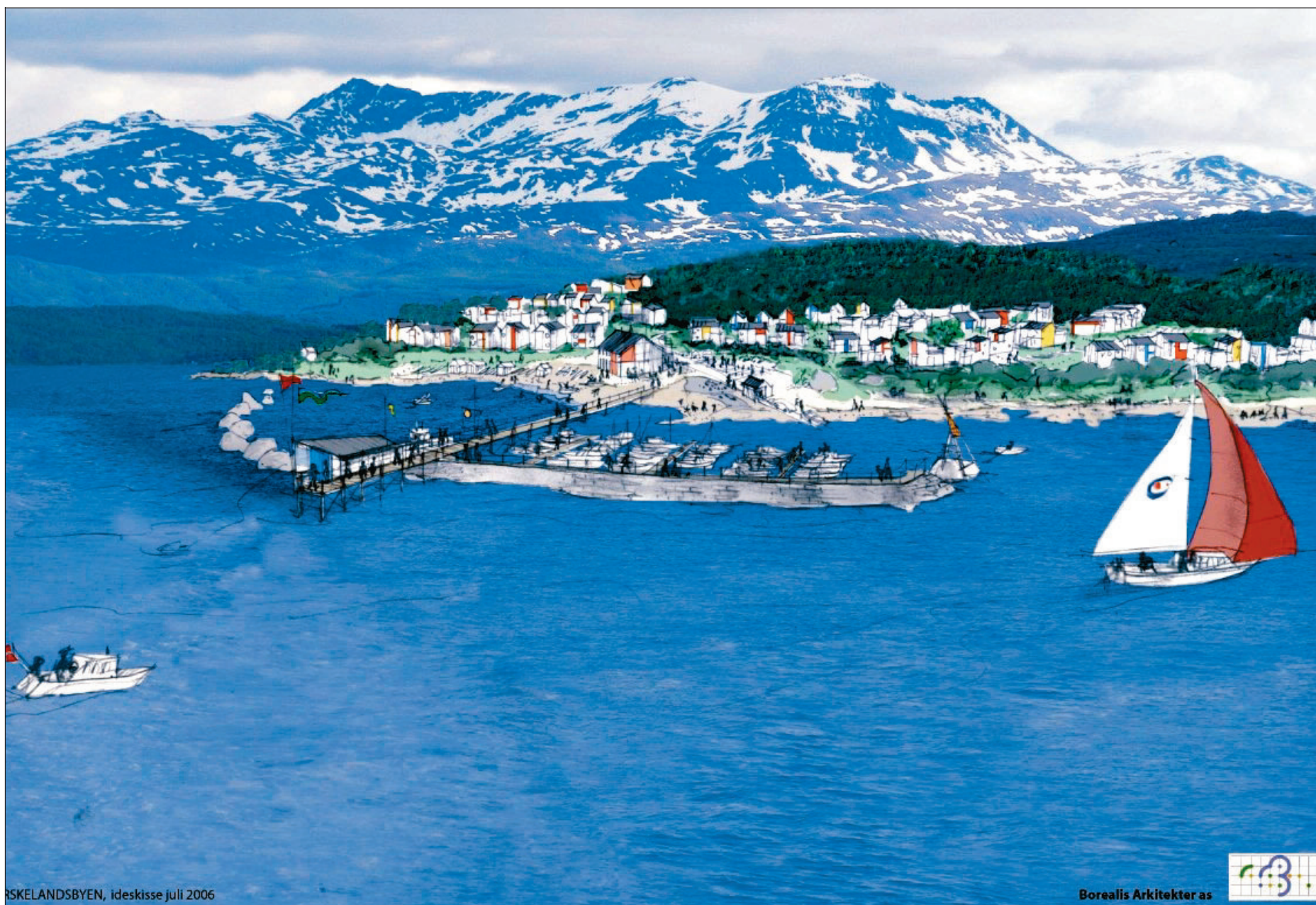
Ideskisse for Torsklandsbyen. Målgruppen er både privatpersoner, bedrifter og investorer.